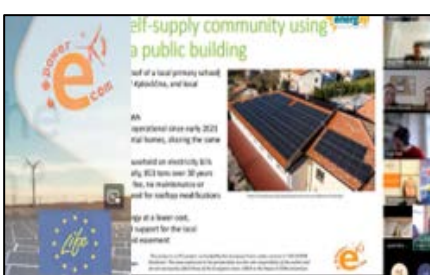
Comunidades de energía renovable en Slovenia: Desafíos e historias de éxito.