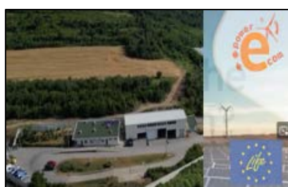
Región Piloto en Gabrovo, Bulgaria: Construyendo comunidades energéticas locales para un futuro sostenible.