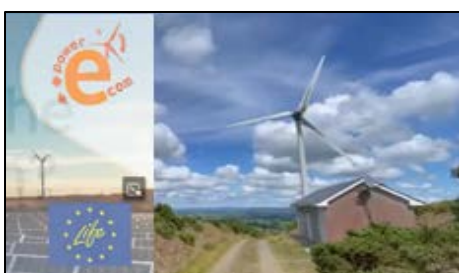
El poder comunitario en Irlanda: La historia de un parque eólico comunitario en Templederry.