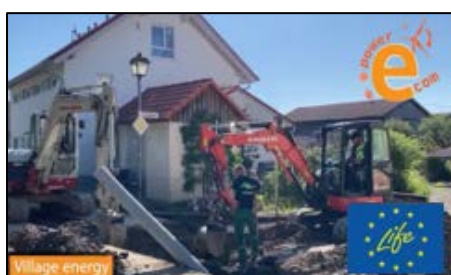
Schwabsoien y Schwabbruck en Bavaria, Alemania: En camino hacia una comunidad climáticamente neutra.