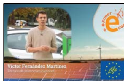
Foco en Rivas, Madrid, España: Aprovechar la energía solar para la independencia energética.